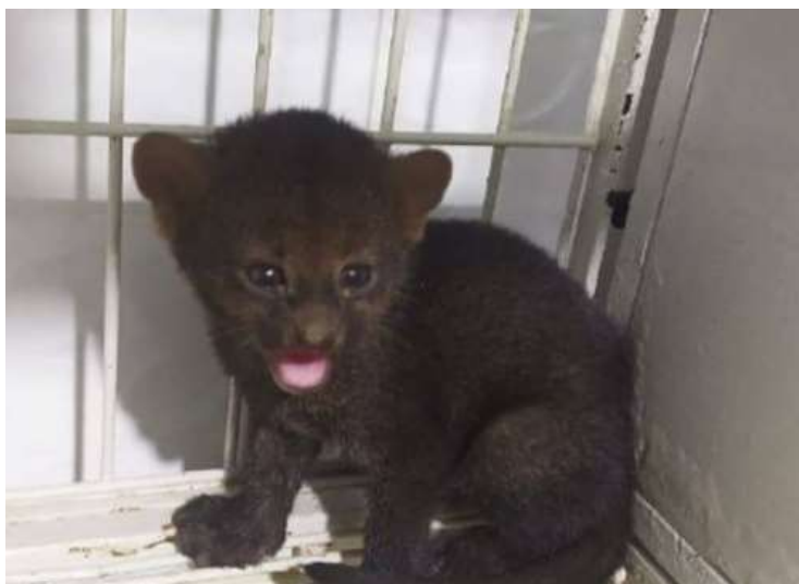
Espécime de Herpailurus_yagouroundi resgatado e enviado ao Centro de Triagem do IBAMA.