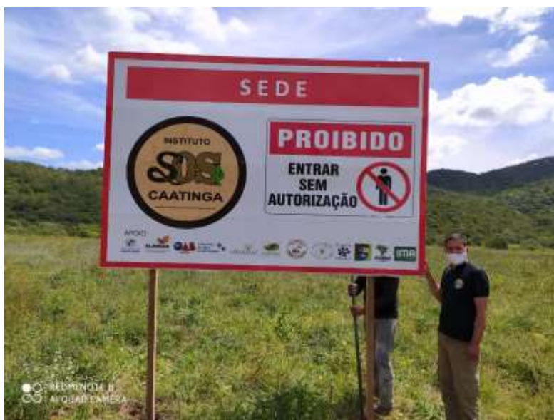
Placa de aviso na área adquirida pelo Instituto SOS Caatinga.

No presente ano, o Instituto SOS Caatinga adquiriu uma área para a construção da Sede da ONG.