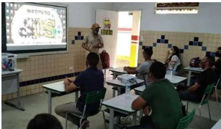
Início das aulas do Projeto “Guardiões da Caatinga”.

No dia 10 de novembro as aulas do Projeto “Guardiões da Caatinga” foram iniciadas.