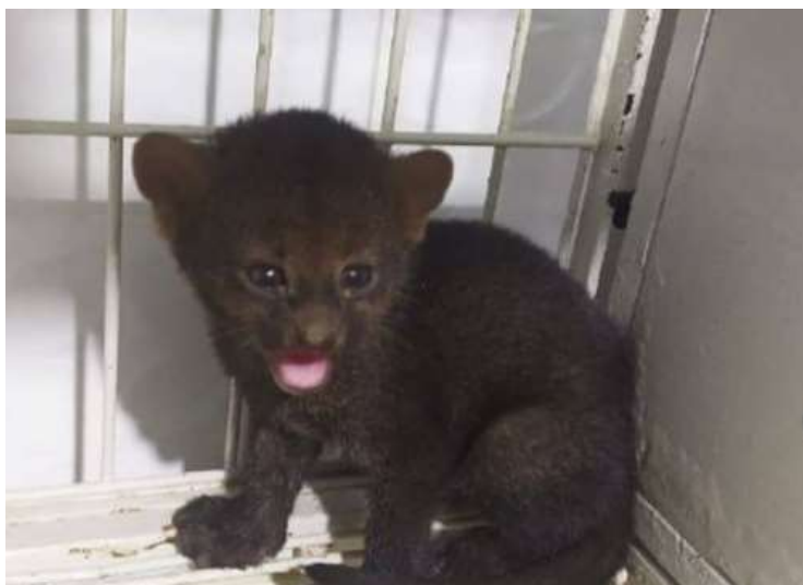
Espécime de Herpailurus_yagouroundi resgatado e enviado ao Centro de Triagem do IBAMA.