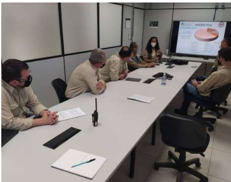
Reunião entre a equipe do Instituto SOS Caatinga e integrantes da Mineradora Vale Verde.

No dia 17 de outubro, após o sucesso da parceria com a Mineração Vale Verde na execução do Projeto Guardiões da Caatinga, o Instituto SOS Caatinga esteve em reunião com a equipe da MVV para apresentar as ações previstas para 2021.