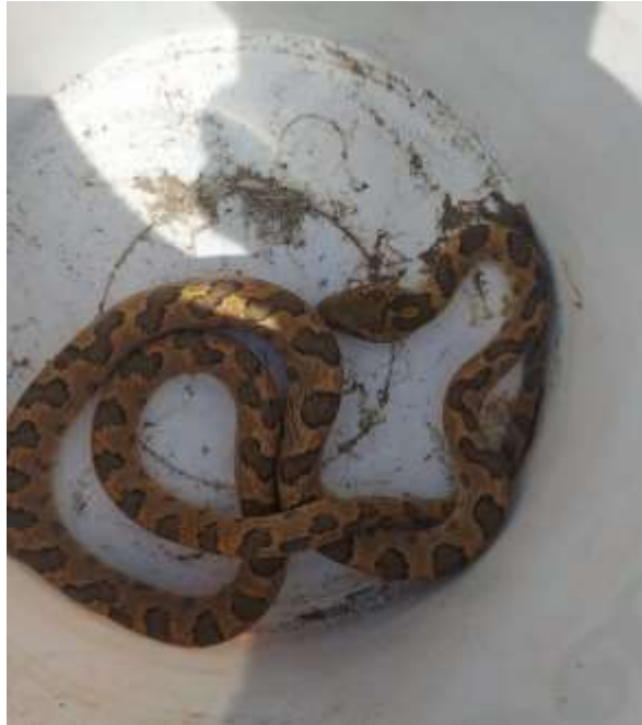
Espécime de Sibynomorphus mikanii resgata.

Resgate de uma serpente conhecida como jararaca dormideira, Sibynomorphus mikanii . O animal foi resgatado e solto em área segura da Caatinga.