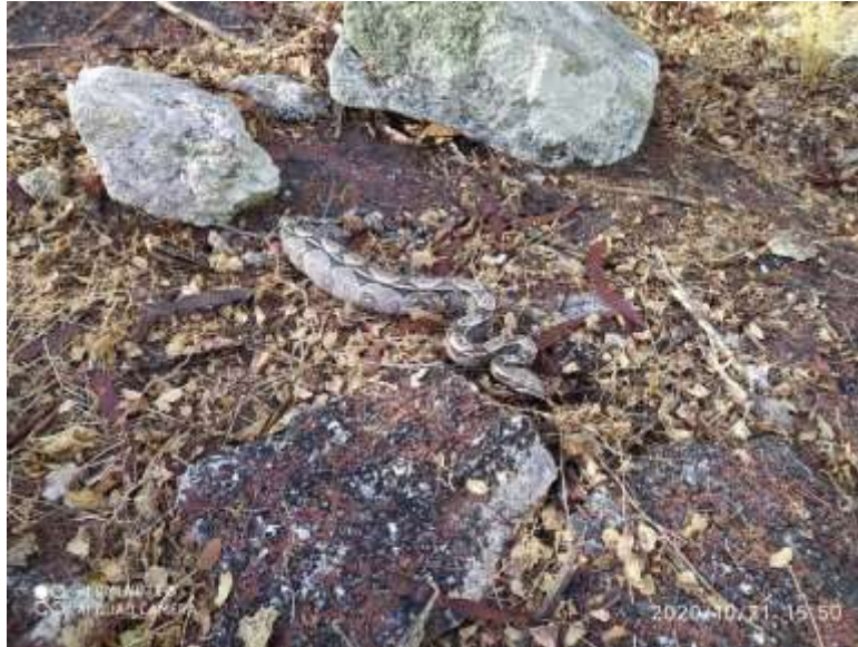
Momento de soltura da Jiboia spp.

Resgate de uma jiboia nas imediações do Povoado Caboclo, município de São José da Tapera. O animal foi resgatado com segurança e solto na região numa região afastada de moradias.