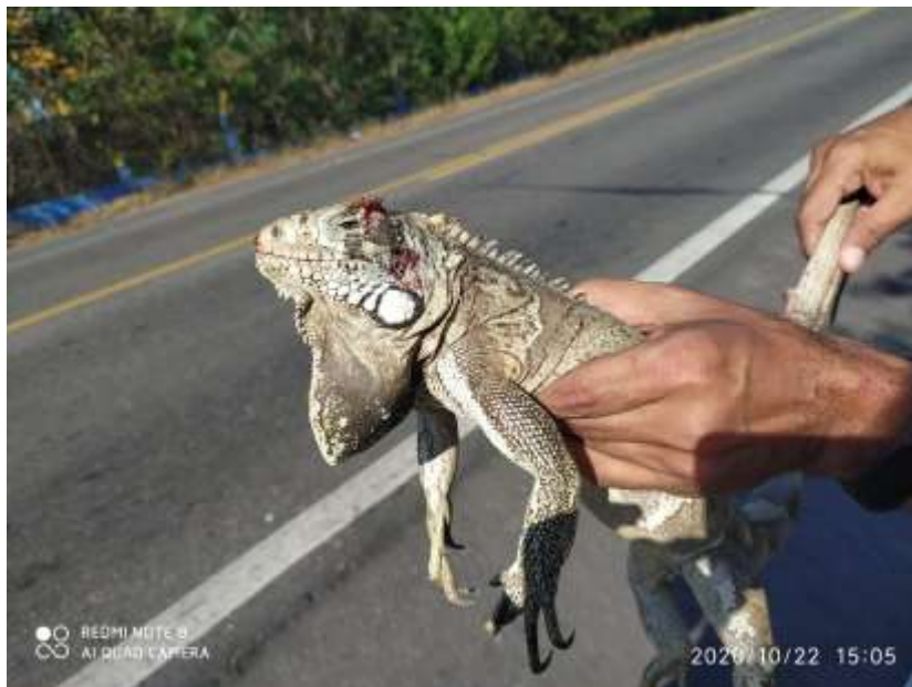
Espécime de Iguana iguana resgatada em rodovia do sertão alagoano.

Resgate de uma Iguana iguana em rodovia no sertão alagoano. O animal machucado, mas aparentemente bem, foi retirado da rodovia e solto em local seguro.