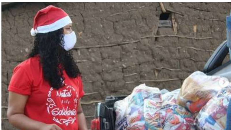
Integrante do ISC durante distribuição das cestas básicas e brinquedos nas comunidades fragilizadas economicamente de São José da Tapera.

O Instituto SOS Caatinga realizou no dia 20 de dezembro de 2020 o Natal Solidário. A proposta foi distribuir cestas básicas e brinquedos para as crianças em comunidades carentes do município de São José da Tapera, para que famílias com a segurança alimentar fragilizada tivessem um Natal digno.