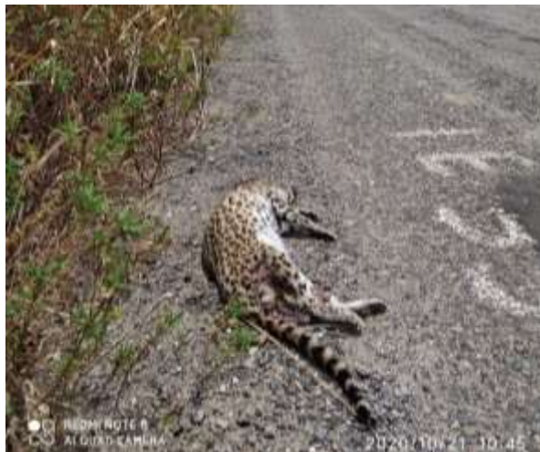
Espécime de Leopardus pardalis atropelado em rodovia do sertão alagoano.

Registro de um espécime de jaguatirica, Leopardus pardalis , numa rodovia do sertão alagoano.