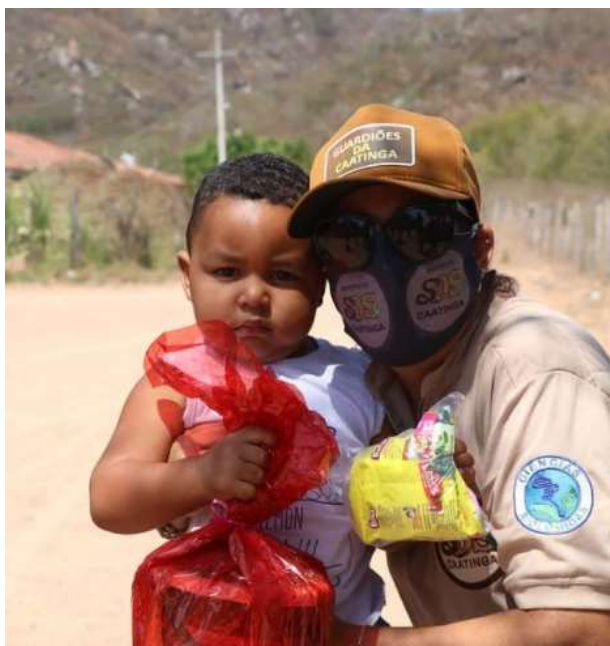
Entrega de brinquedos no Dia das Crianças em comunidades de São José da Tapera.

No Dia das Crianças, 12 de outubro, o Instituto entregou presentes para 160 crianças nas comunidades de São José da Tapera.