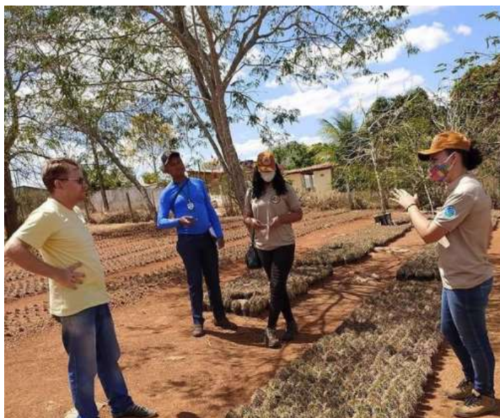
Equipe do Instituto SOS Caatinga visita a sementeira da Chesf, em Xingó.

No dia 19 de outubro, a equipe do Instituto realizou uma visita à sementeira da Chesf, em Xingó.