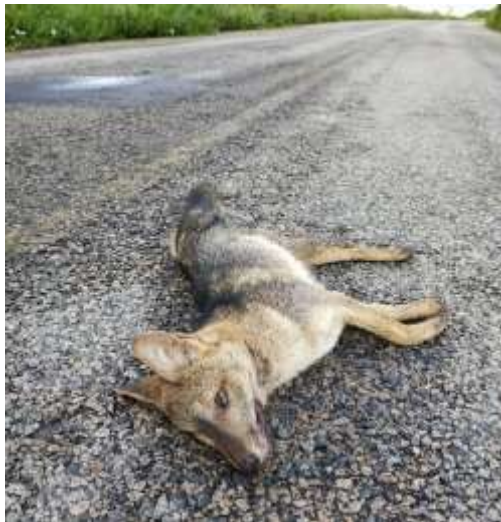
Espécime de Cerdocyon thous atropelado em rodovia do sertão alagoano.

Foi registrado um espécime de raposa, Cerdocyon thous , atropelado e morto numa rodovia do sertão alagoano.