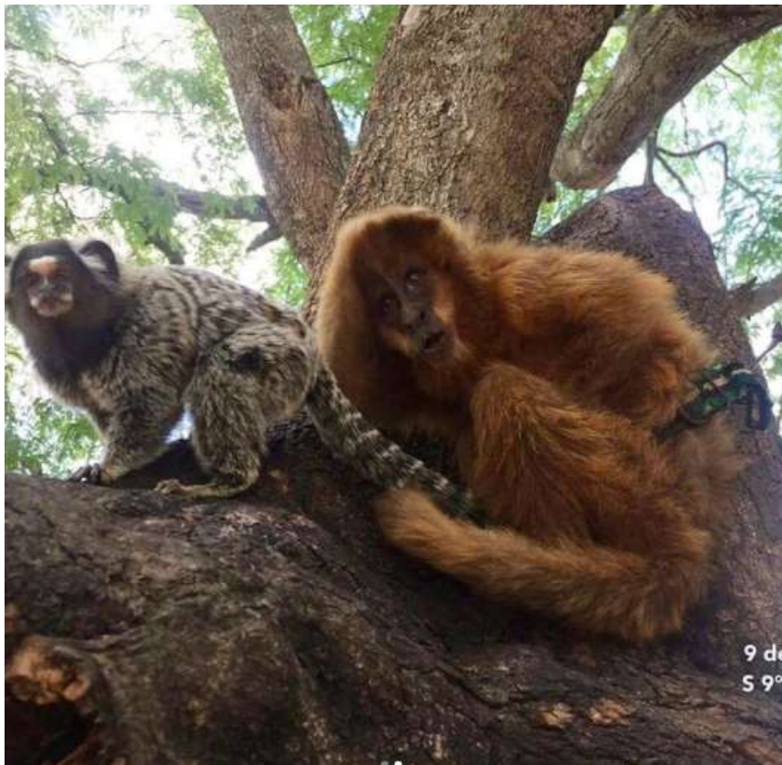
Macaco-prego acorrentado em uma árvore.

O Instituto SOS Caatinga e o Batalhão de Polícia Ambiental resgatou um macaco-prego no sertão de Alagoas. No momento do resgate, o animal cativo foi encontrado acorrentado à uma árvore; assim ele viveu por cerca de 14 anos, segundo informações. O animal se mostrou muito assustado com a aproximação da equipe. O primata foi encaminhado ao CETAS do Ibama para passar por exames clínicos.